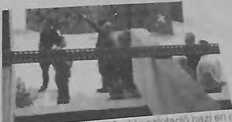
Neonazi de Sabadell fent la salutació nazi en un acte de SCC a la il·lusa de Polítiques i Sociologia de la UAB, 22 d'abril de 2016

I per si no fóra poc, SCC va organitzar una concentració a Tarragona on l'organització neofeixista Democracia Nacional (DN) va convocar la seva militància a l'acte d'SCC. DN és una formació nascuda de les cendres de l'extinta organització d'extrema dreta Juntas Españolas (JEE) i també amb destacats militants del neonazi Círculo Español de Amigos de Europa (CEADE).